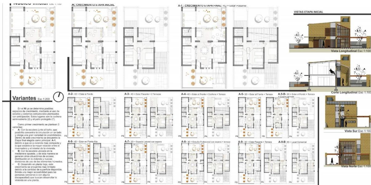
Fig. N°4. Plantas tipo y algunas de las variantes, entrega de Trabajo Practico Vivienda Evolutiva en La Quiaca. Estudiante F. Carrasco. 2019.

La mirada metaproyectual propicia que los estudiantes centren sus esfuerzos en determinar aquellos factores o aspectos que condicionan fuertemente los resultados. Esta valoración crítica define la estrategia a seguir, involucrando también su creatividad para reinterpretar restricciones en oportunidades. Por ejemplo, las decisiones acerca de la posición y diseño de los “núcleos de servicio” (baños- cocina, solicitados fuertemente por instalaciones), promueven o limitan la posibilidad de los usos (estar, comer, dormir, trabajar...) en función de las dimensiones del terreno, la orientación, el programa específico, etc. Esta oportunidad de comprender a la vivienda como repetible y modificable otorga conciencia acerca de las variables que van a facilitar o a condicionar la apropiación de la misma (Figura 4). Impacta de manera negativa cuando solo se comprende como un catálogo de opciones, y no se tamiza con el juicio profundo de necesidad y veracidad de las mismas, que puede lograrse en el trabajo de campo real y en el devenir del hacer.