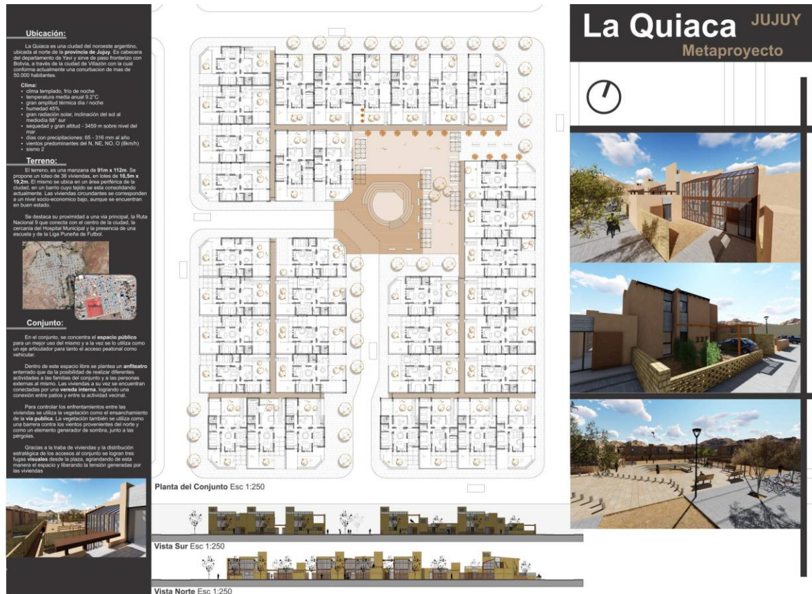
Fig. N°5. Plantas y vistas del conjunto, entrega de Trabajo Practico Vivienda Evolutiva en La Quiaca. Estudiante F. Carrasco. 2019.

El proyecto de VE conlleva a la resolución de un conjunto habitacional, de este modo aparecen la escala doméstica y la escala urbana, desarrollándose propuestas que contribuyen a “hacer ciudad” estructurada, pero también cualificada (Figura 5). Esta premisa constituye uno de los puntos de valoración esenciales del ejercicio, donde no solo se visualizan las destrezas proyectuales, sino donde se transparentan las diversas miradas respecto de la pluralidad y diversidad de los usuarios. La riqueza de este trabajo radica justamente en unas apetencias espaciales urbanas (aunque a veces utópicas) de vida comunitaria, en esta tensión entre lo real, lo posible y lo deseable.