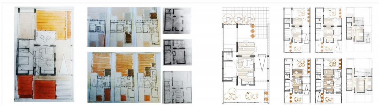
Fig. N°2. Pasaje de croquis de proceso a prototipos de entrega de Trabajo Practico de Vivienda Evolutiva. Estudiante F. Carrasco. 2019.

o el asesoramiento de especialistas puede constituirse, mediante la formalización de los procedimientos o actividades involucradas, en un "método de búsqueda de información". Con la exteriorización del pensamiento nos referimos a la necesidad de "hacer público" el pensamiento del proyectista a modo de "exteriorizar el proceso de diseño". El propósito subyacente es hacer "explícito" este proceso y una ventaja adicional es la posibilidad de que otras personas, tal como los docentes y compañeros, usuarios o los demás integrantes de un equipo de diseño, puedan seguirlo para contribuir con información y experiencias renovadas, dinámica que alimenta y sustenta el trabajo en taller. La modalidad de exteriorizar las reflexiones refiere, por ejemplo, a la realización de croquis, plantas, cortes o vistas (expresiones gráficas), diagramas conceptuales, cuadros o análisis del programa, y modelos o maquetas que tratan de extraer y mostrar los pensamientos y procesos mentales del diseñador (Figura 2). La exteriorización constituye un auxiliar importante al momento de encarar problemas complejos de diseño, a la vez que una herramienta fundamental del proceso de diseño, en primera instancia para la comprensión y valoración del propio proyectista, y por consiguiente al trabajo en equipo, actitud que permite que todos los miembros accedan a lo que está pasando y puedan contribuir con sus aportes en el proceso de diseño.