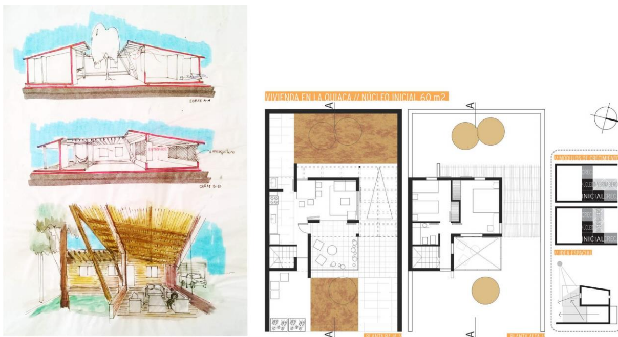
Fig. N°3. Incorporación de factores climáticos, culturales-sociales, técnicos y económicos. Izq. Croquis estudiante Hernández, Vivienda Evolutiva en Posadas, 2016. Der. Plantas y esquemas de estudiante J. Cardoni, Vivienda Evolutiva en La Quiaca, 2014.

Se logra el desarrollo de una VE desde una posición casi profesional, dado que se comprenden una multiplicidad de factores. Los factores climáticos, culturales-sociales, técnicos y económicos son asimilados más fácilmente por los estudiantes, y se ven reflejados en propuestas de materialidad y morfología, en propuestas de apropiación del espacio exterior de la vivienda, estrategias de ocupación del territorio y restricciones de superficie construida, en general sugerida por los docentes (Figura 3).