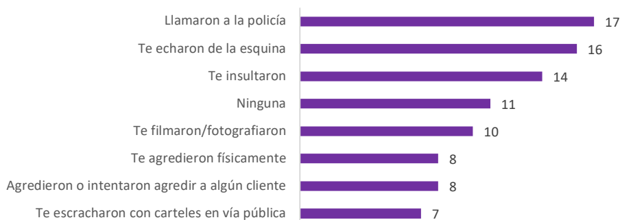
FIGURA 5. Conflictos con los/as vecinos/as residentes en las zonas de comercio sexual, luego de la entrada en vigencia de la ordenanza N° 25.590 (respuesta múltiple)