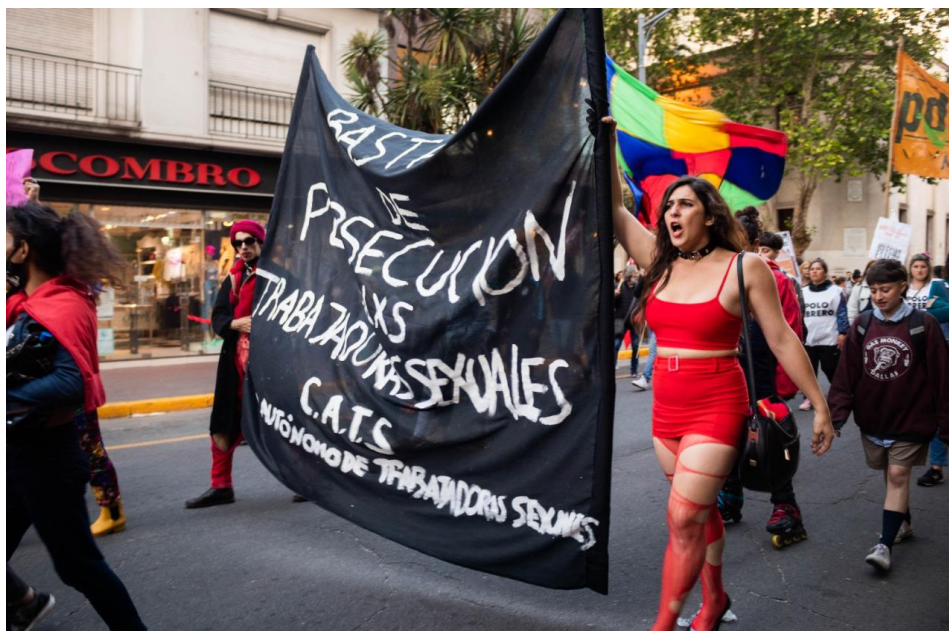
FIGURA 1. Marcha en el marco del Día Internacional de la Eliminación de la Violencia contra la Mujer, el 25 de noviembre de 2022 en Mar del Plata.

Luego de la derogación de los edictos, varias provincias incluyeron artículos que permitían la persecución de este colectivo –generalmente a través de la criminalización del trabajo sexual callejero, con argumentos vinculados al uso del espacio público– en sus Códigos de Faltas, Códigos Contravencionales o Códigos de Convivencia Urbana, que requieren de la intervención judicial, quitándole poder discrecional a la policía. En la actualidad, en 17 provincias aún están vigentes códigos contravencionales que penalizan el trabajo sexual callejero, imponiendo multas y arresto de hasta 30 días 4 . En 2018, la Provincia de Buenos Aires derogó el art. 68 del Código Contravencional de Faltas que perseguía y reprimía la prostitución. De modo que la sanción de la ordenanza N° 25.590 en la ciudad de Mar del Plata representa un retroceso al volver a incluir en la normativa municipal la persecución de la prostitución en la vía pública, realizada por fuera de la zona estipulada para tal fin, y al otorgarle poder de control a la policía local.