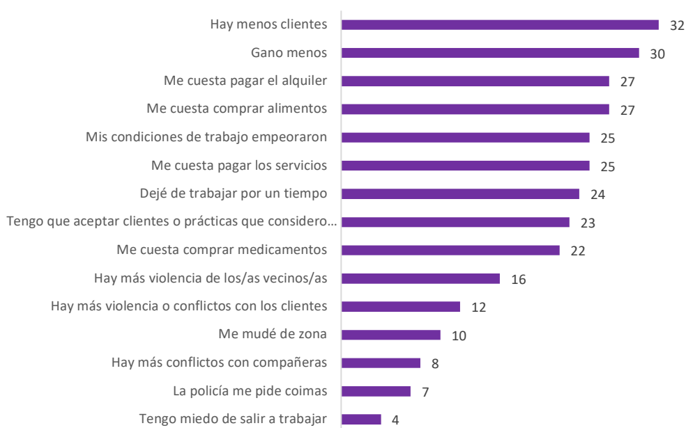
FIGURA 6. Efectos de la implementación de la ordenanza N° 25.590 sobre las trabajadoras sexuales (respuesta múltiple)