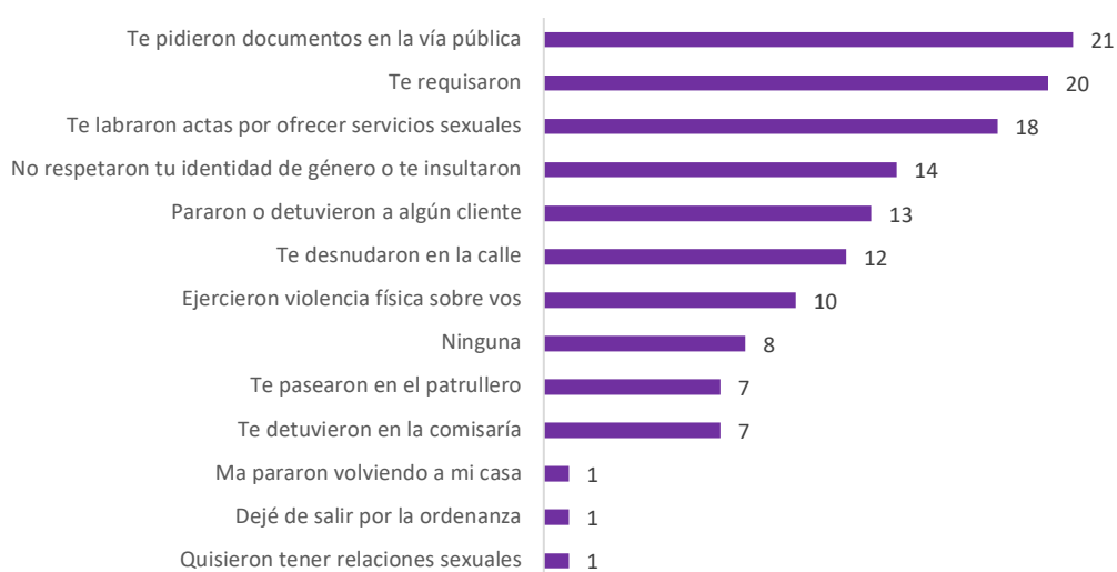
FIGURA 4. Situaciones con las fuerzas de seguridad luego de la entrada en vigencia de la ordenanza N° 25.590 (respuestas múltiple)