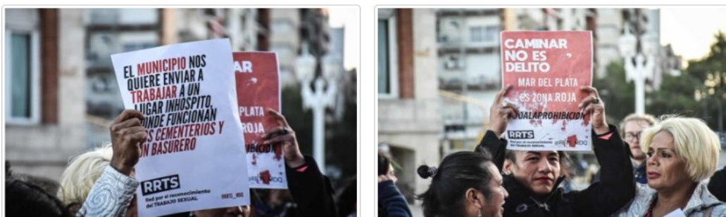
FIGURA 2. Manifestación en el marco de la inauguración del Festival Internacional de Cine en el Teatro Auditorium