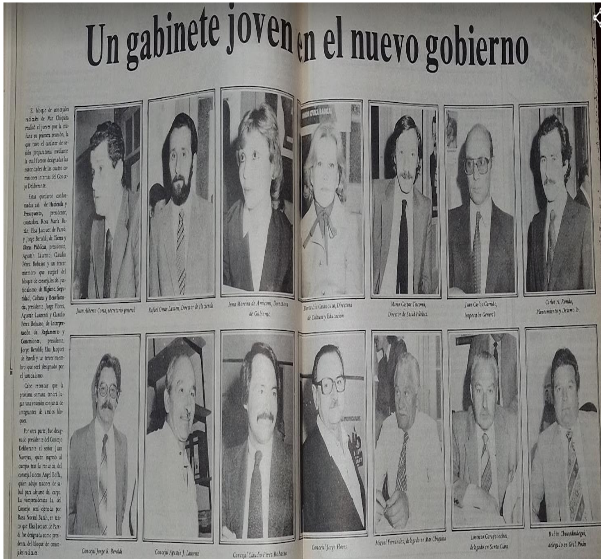
Foto: Un gabinete joven en el nuevo gobierno