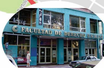
Facultad de Derecho