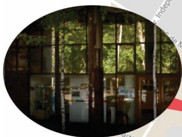
Instituto Movilizador de Fondos Cooperativos