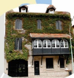
La Casa del Balcón